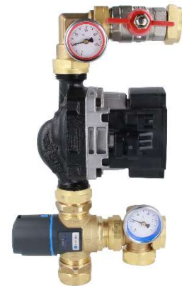
Рис. 1. Смесительный модуль BTU с клапаном АТМ

Смесительный модуль BTU состоит из термостатического смесительного клапана АТМ 561 (1), циркуляционного насоса (2), двух термометров (3), запорного клапана (4) и латунных соединительных элементов. Смесительный модуль BTU должен быть соединен с отопительной установкой на стороне источника тепла с помощью двух гаек GW G1". Мы рекомендуем использовать шаровые запорные клапаны для подключения модуля с установкой. К распределителю модуль также привинчивается с помощью гаек GW G1". Разделители AFRISOBasic уже оснащены комплектом ниппелей с уплотнением для легкого подключения модуля смешения. Во время нормальной работы запорный клапан модуля (4) должен быть открыт, т. е. ручка должна быть расположена вдоль клапана. Клапан можно закрыть, например, для замены циркуляционного насоса.